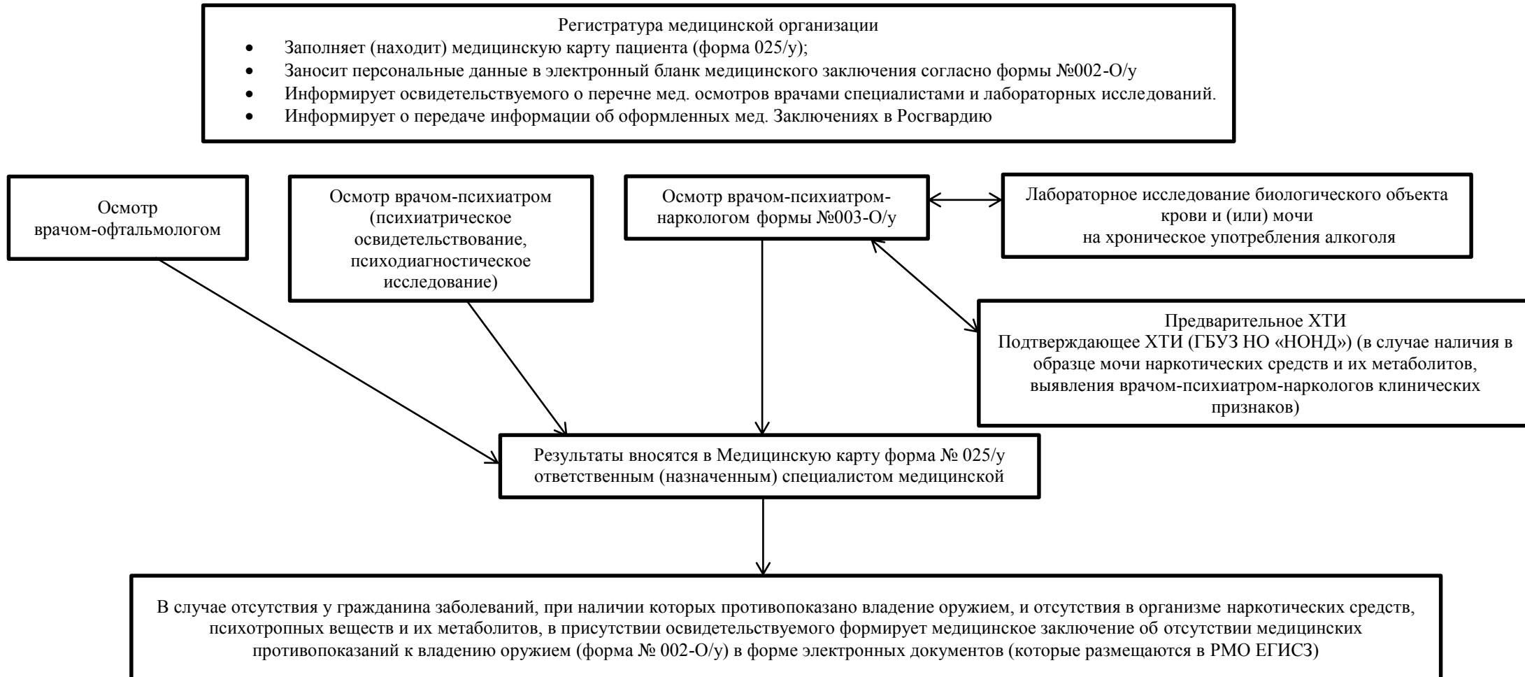
Схема организации медицинского освидетельствования на наличие медицинских противопоказаний к владению оружием